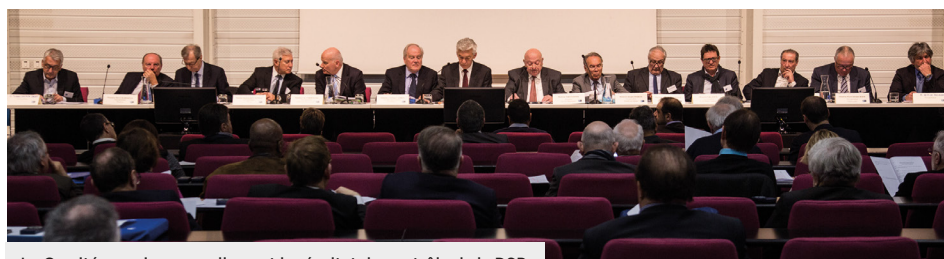
Le Comité examine annuellement le résultat du contrôle de la DSP.

Le niveau de satisfaction globale se situe en 2016 entre 88 % et 95 % selon les cibles et les résultats de l'Observatoire permettent au SEDIF de mieux cibler les aspects du service sur lesquels il doit renforcer son action et sa vigilance.