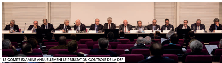
LE COMITÉ EXAMINE ANNUELLEMENT LE RÉSULTAT DU CONTRÔLE DE LA DSP

www.sedif.com , Nos publications / Observatoire