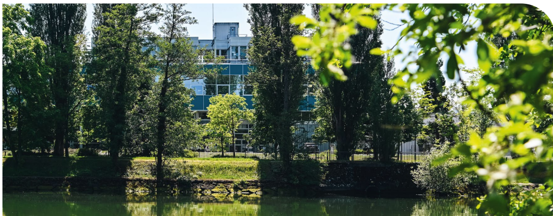
Usine de Méry-sur-Oise (Val d'Oise).