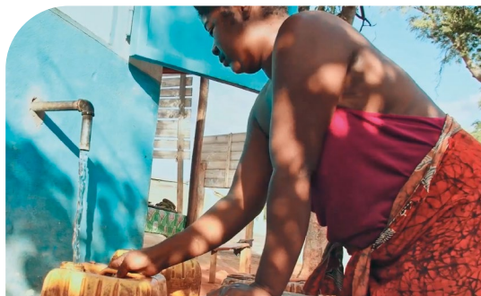
Projet financé par le SEDIF à Madagascar.

Depuis 1986, le SEDIF est aussi engagé à l'international pour favoriser l'accès à l'eau dans les pays en développement. Il consacre 1,15 centime d'euro par mètre cube d'eau vendu à des actions de coopération en Afrique et en Asie, en partenariat avec des ONG. Depuis sa création, le programme Solidarité Eau a financé des opérations pour 52 millions d'euros et a bénéficié à 5,2 millions de personnes dans une vingtaine de pays.